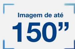
Imagem de até 150" em Full HD, com cores vibrantes mesmo sob luz ambiente.