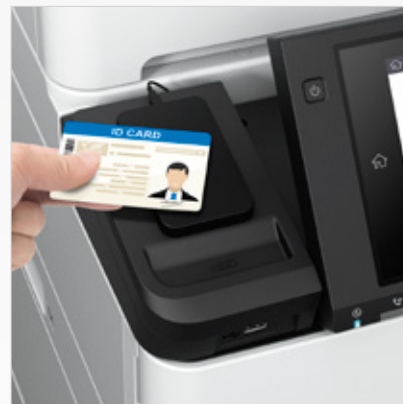
Identificación de usuarios mediante contraseñas, códigos PIN o tarjetas de acceso*

*Tarjetas se venden por separado. **Incluido en el paquete en este sistema. 1 - Basado en MSPR publicado de compañías OEM de software de gestión de impresión, hasta 100 dispositivos, a partir de julio de 2017. Los precios de los distribuidores pueden variar. Precios sujetos a cambio.