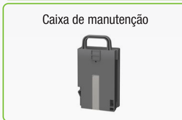
Caixa de manutenção