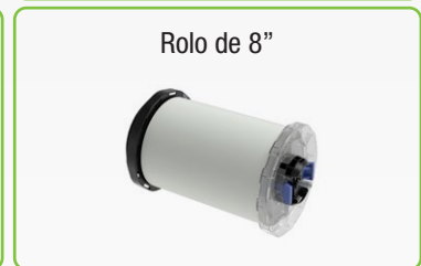
Rolo de 8"

*Os cartuchos de tinta preta brilhante SJIC35P-K e a tinta preta fosca SJIC35P-MK estão configurados desde o início no equipamento, você deve selecionar a opção que mais se adapta às suas necessidades, após selecionar a tinta a ser utilizada, não poderá mais alterar o tipo de tinta preta, pois não são intercambiáveis.