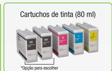
Cartuchos de tinta (80 ml)