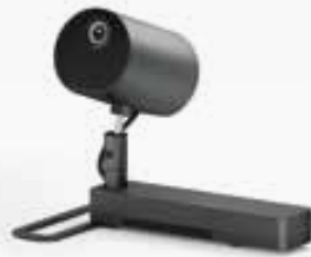
LightScene™ EV-105 se muestra con opcional soporte de suelo, se vende por separado.

*La velocidad máxima y el rango es alcanzable cuando se usa con la misma tecnología de modo mejorado. Los datos reales, las características y el rendimiento pueden variar dependiendo de su sistema informático, del medio ambiente y otros factores. 1. Cuando se usa en el modo Eco, se estima que la vida útil de la fuente de iluminación es de 30.000 horas. El tiempo real puede variar dependiendo del modo de uso y ambiente. El videoprojector tiene una garantía limitada de 3 años o 20.000 horas, lo que suceda primero. 2. En comparación con los videoprojectores líderes DLP de 1-chip para empresas y educación, basado en datos de NPD, desde julio de 2011 hasta junio de 2012. La luminosidad del color (salida de luz en color) se midió según la norma IDMS 15.4. La luminosidad del color variará según las condiciones de uso. 3. La tarjeta de memoria no viene incluida. 4. La luminosidad del color (salida de luz en color) y la luminosidad del blanco (salida de luz blanca) variará según las condiciones de uso. La salida de luz en color se mide según la norma IDMS 15.4; la salida de luz blanca se mide según la norma ISO 21118. 5. Visita https://latin.epson.com/medio-ambiente para obtener información acerca de opciones de reciclado convenientes y razonables.