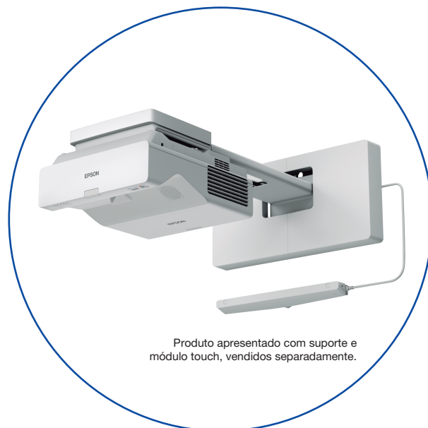
Produto apresentado com suporte e módulo touch, vendidos separadamente.

Transforme a sala de aula e atraia a atenção dos alunos com uma grande projeção interativa