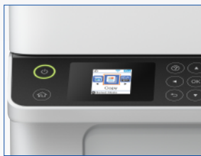
Visor LCD colorido de 1,44"