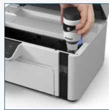
Novo sistema de abastecimento EcoFit™

Economize até 90% em comparação com laser, usando garrafas de reposição*.