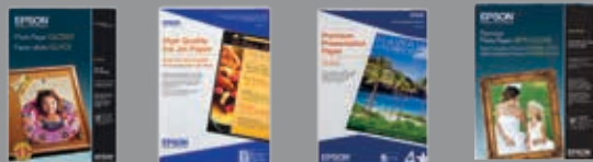
Photo Paper Glossy

Encontre o papel ideal para os seus projetos.