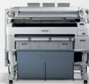
T5270 con escáner opcional