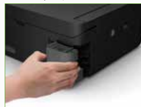
Caixa de manutenção substituível