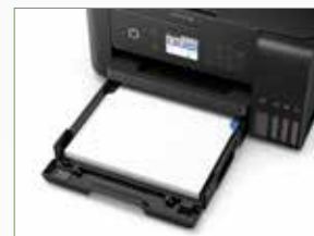
Bandeja frontal de 250 folhas