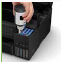
Novo sistema de abastecimento EcoFit™