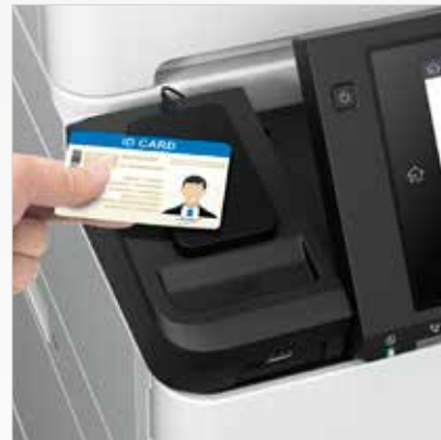
Identificação de usuários através de senhas, códigos PIN ou cartões de identificação

* Os cartões são vendidos separadamente. ** Incluso no pacote neste sistema.