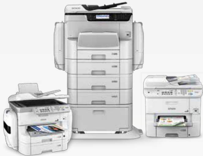
Epson Print Admin compatível com multifuncionais WorkForce® Pro habilitadas para a Plataforma Aberta da Epson (Epson Open Platform)