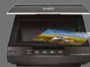
Epson Perfection V600 Photo