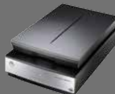
Epson Perfection V850 Pro