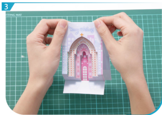
將卡上的黑線剪開。按摺線摺疊。