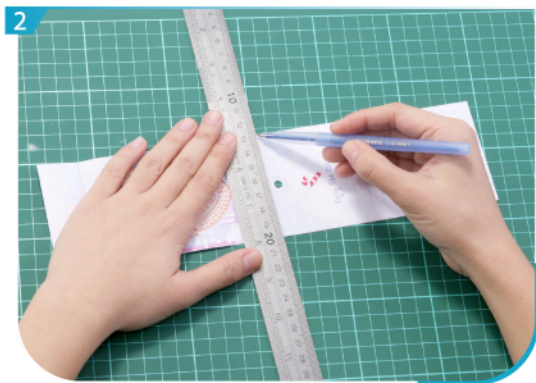
用沒有墨水的原子筆或鐵筆劃一下摺線。