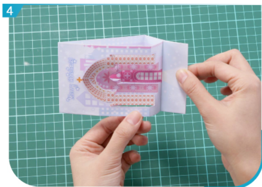
按貼位黏合即成一張心意賀卡。