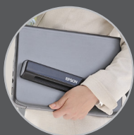
Portabilidade sem igual