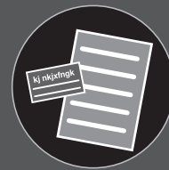
Digitalização de uma ampla variedade de documentos