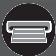
Geração de documentos PDF editáveis