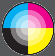
Scanner em cores