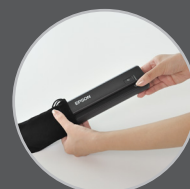
Bolsa para transporte inclusa