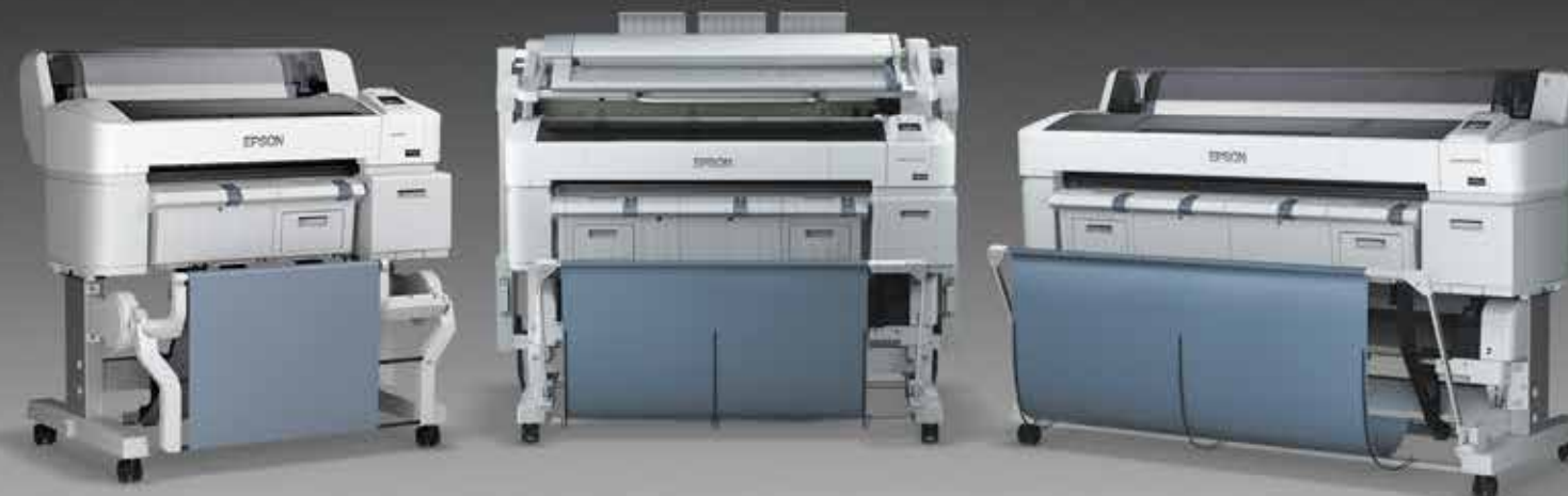
SureColor® T3270 Impressora com rolo simples de 61 cm (24")