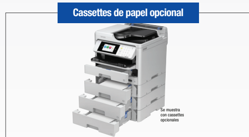
Cassettes de papel opcional

Conozca las últimas innovaciones de Epson Business Solutions en latin.epson.com/impresoras-de-inyeccion-de-tinta-para-negocios