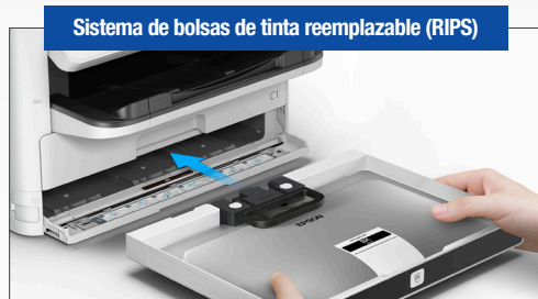
Sistema de bolsas de tinta reemplazable (RIPS)