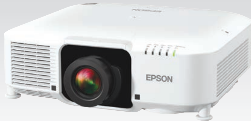
Producto mostrado con lente. La lente se vende por separado.