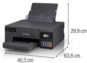
*Dimensões da impressora aberta