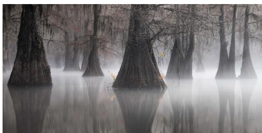
Aberto/Paisagens: 1º Lugar: Joshua Hermann – EUA/thepanoawards.com

Apesar das dificuldades enfrentadas em todas as partes do mundo, durante a pandemia, o concurso do ano passado superou as expectativas e recebeu 5.378 imagens inscritas, de autoria de 1.245 fotógrafos localizados em 97 países diferentes. As imagens ganhadoras da edição passada podem ser baixadas aqui . (Favor creditar cada fotógrafo e o prêmio 'Epson International Pano Awards' com o website: https://thepanoawards.com ).