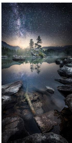
Amador/Paisagens: 1º Lugar - Daniel - Trippolt - Austria / thepanoawards.com