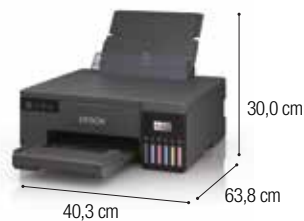
¹ Dimensões da impressora aberta