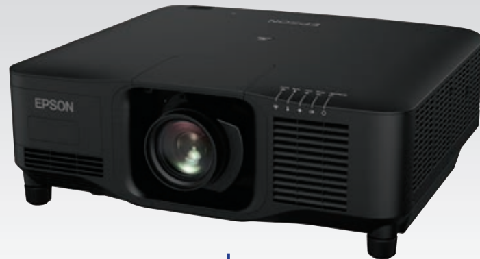
El producto se muestra con lente, los lentes se venden por separado

Brillo en color: 16 000 lúmenes 1 Brillo en blanco: 16 000 lúmenes 1