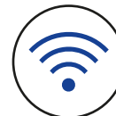
Sem fios 2