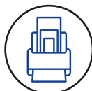
ADF 20 páginas