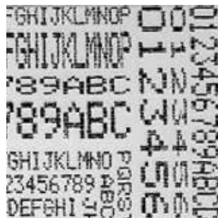
Exemplo de impressão na TM-U295 utilizando recurso do "page mode"