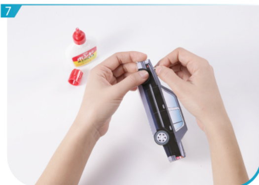
7 最後將鏡子貼於的預定位置上，的士製作完成。