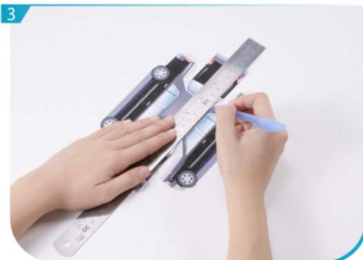
3 用沒有墨水的原子筆或鐵筆劃一下摺線。