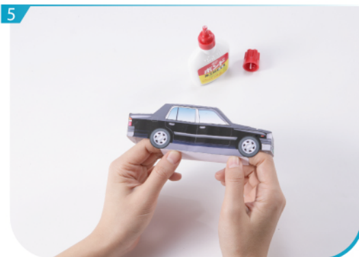
5 按貼位黏合，形成的士車身。