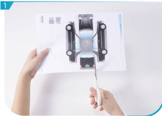
1 沿線剪出所有組件。