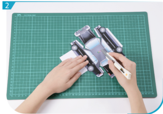
2 將車頂上的黑線割開。